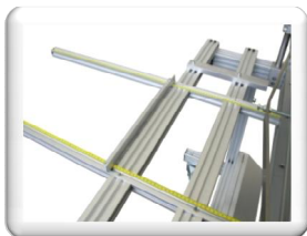
Tiefenanschlag 800 mm